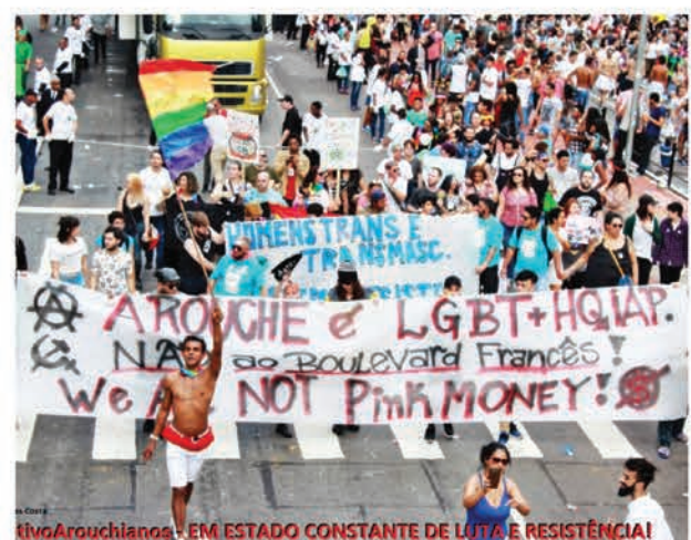
HivArouchianos - EM ESTADO CONSTANTE DE LUTA E RESISTÊNCIA!

Os blocos LGBTQIA+ são grupos que nascem com o intuito de levar protagonismo e representatividade para o Carnaval de Rua. Além do carnaval, alguns blocos também se apresentam nas paradas LGBTQIA+ e atividades culturais de rua voltadas para a manifestação do orgulho. Siriricando é um exemplo de bloco LGBTQIA+ que reforça a luta de mulheres lésbicas e bi: "Nossos direitos vamos defender/ Patriarcado vamos derrubar no Carnaval".